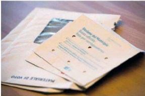
Proposte in materia comunale